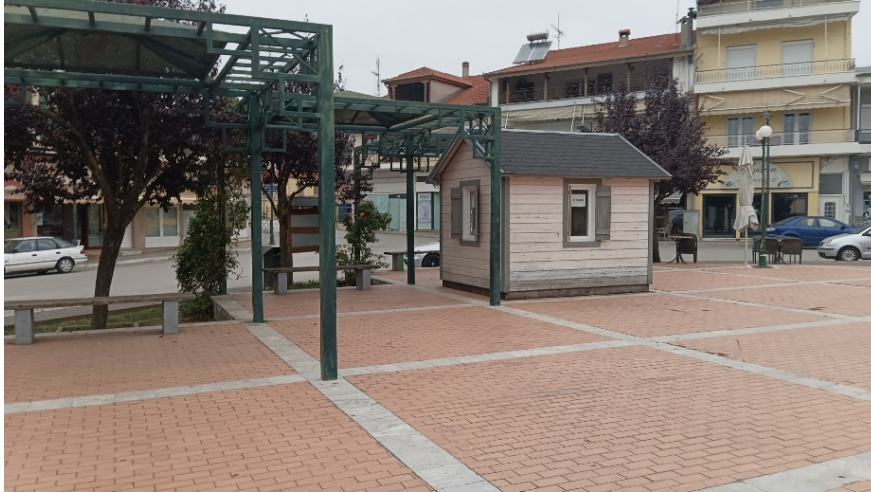
Ξύλινο σπιτάκι και μεταλλική πέργκολα στο Τμήμα Γ

Στο τμήμα Γ, στο βόρειο τμήμα του, υπάρχει τοποθετημένο ξύλινο σπιτάκι πληροφοριών το οποίο όμως τα τελευταία χρόνια χρησιμοποιείται αποκλειστικά από το σημείο αναμονής των ταξί. (πιάτσα)